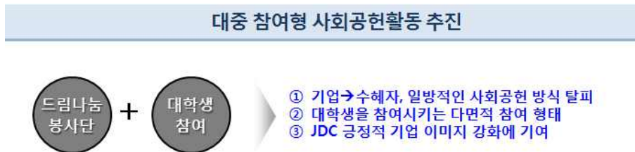
[그림 4] JDC 대중 참여형 사회공헌 활동 추진

대학생 서포터즈를 대상으로 JDC CSR활동 상세내용 및 부활호 이론강의, 칼레이도 사 이클 만들기, JAM 찾아가는 박물관 프로그램 대학생 서포터즈 보조강사 활용 등을 통한 교육을 시행하였다. 이러한 과정을 통해 실제 추진된 활동으로 대학생 서포터즈의 제주지역아동센터, 행복한 쉼터, 우도면 주민센터 IT 봉사 등이 있다.